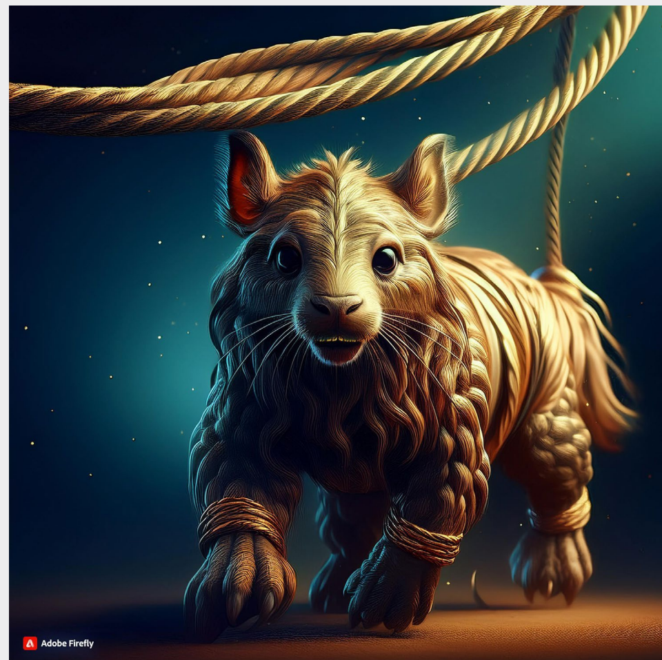
Zvíře s mávajícím ocasem, jako provaz.