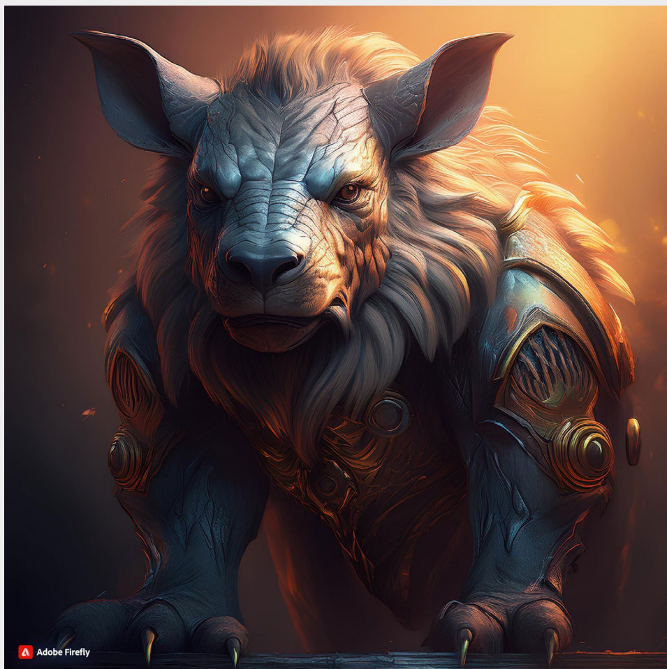
Zvíře se širokými a robustními boky, jako zed'.