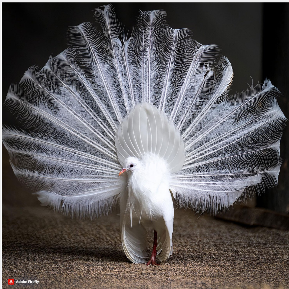
Zvíře podobající se věžiči.