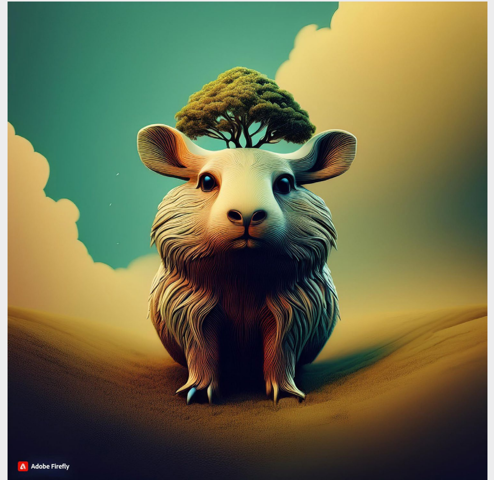
Prostě zvíře jako strom.