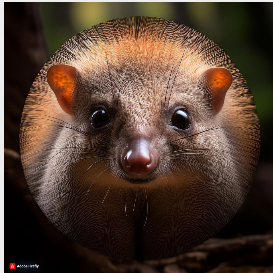
Zvíře velmi kulaté, hebké a ostré jako oštěp.