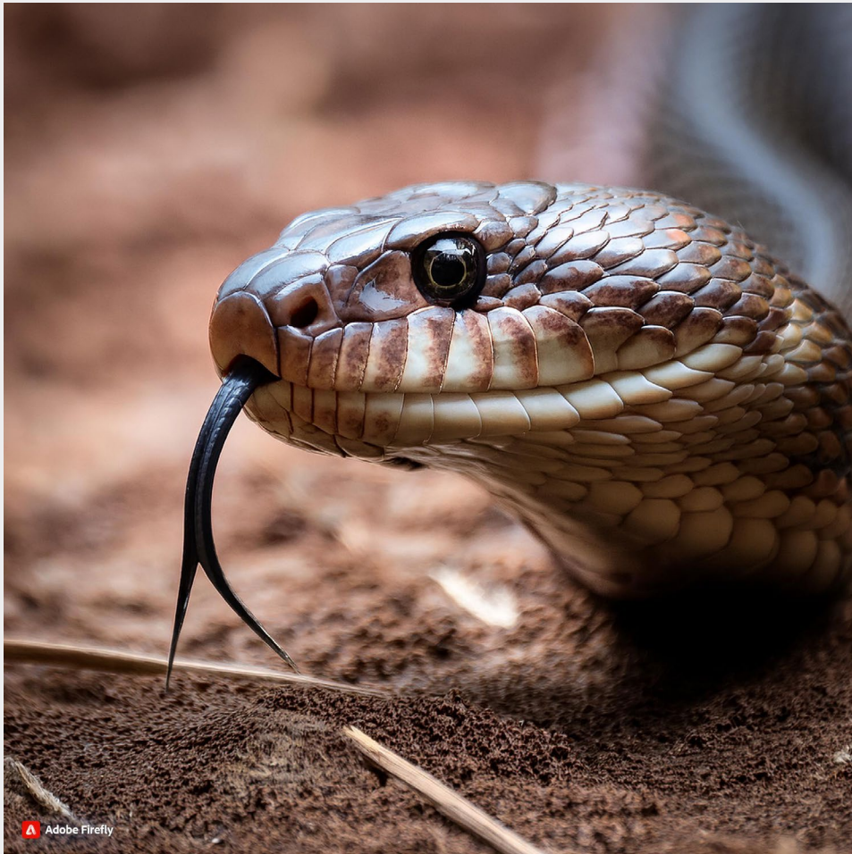
Zvíře s vlnitým tělem, podobné hadovi.